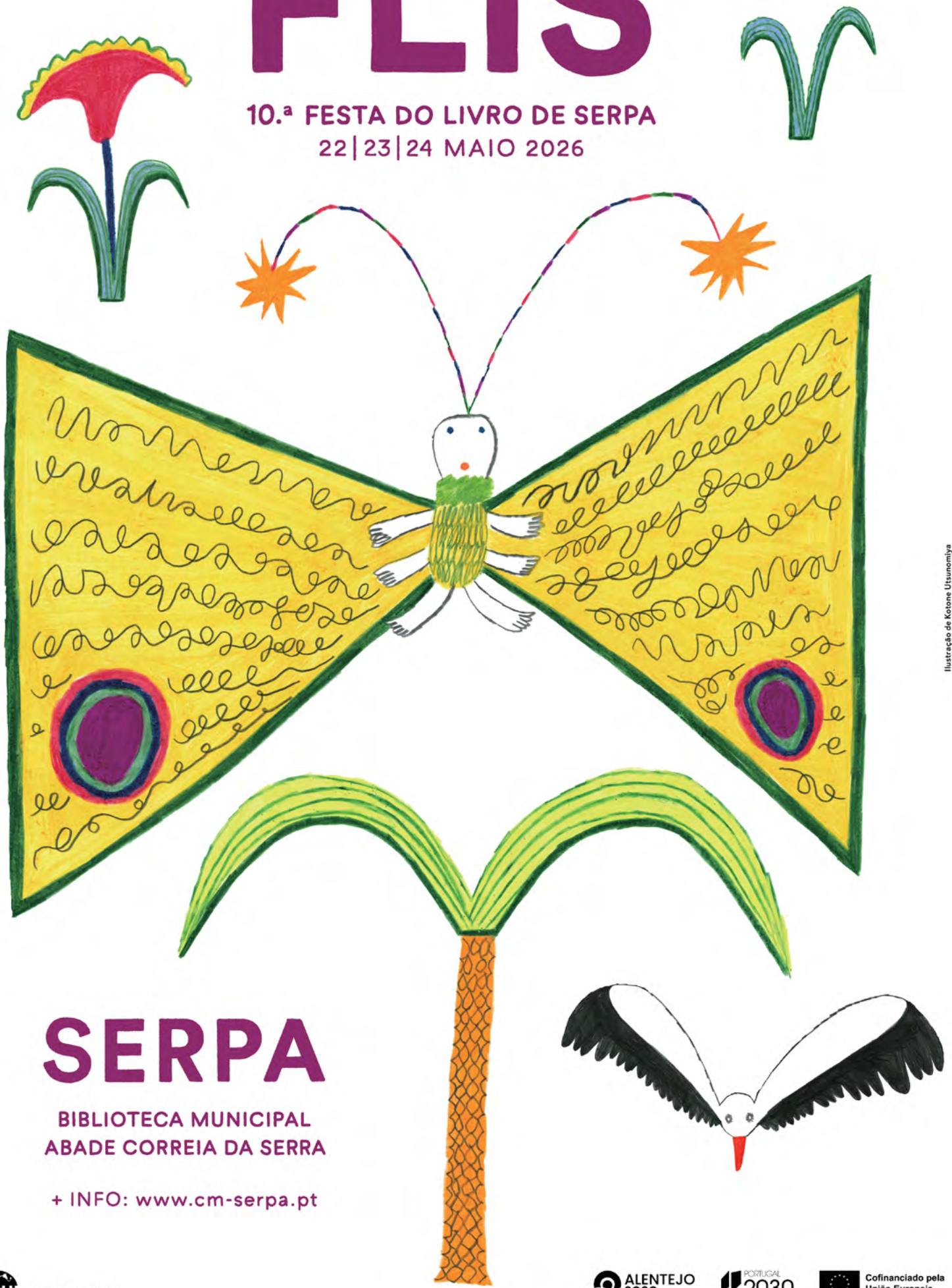
Ilustração de Kotone Utsunomiya

10.ª FESTA DO LIVRO DE SERPA 22|23|24 MAIO 2026