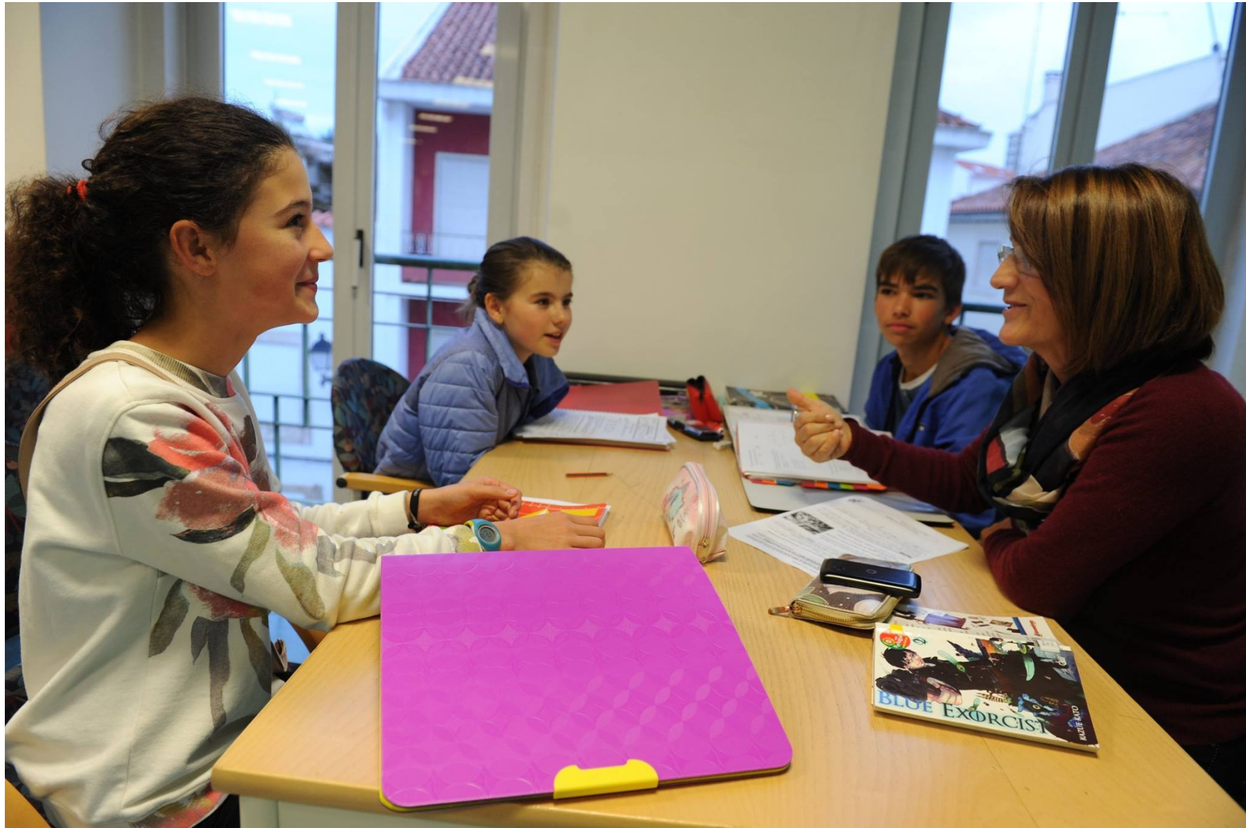
BIBLIOTECA MUNICIPAL AFONSO LOPES VIEIRA