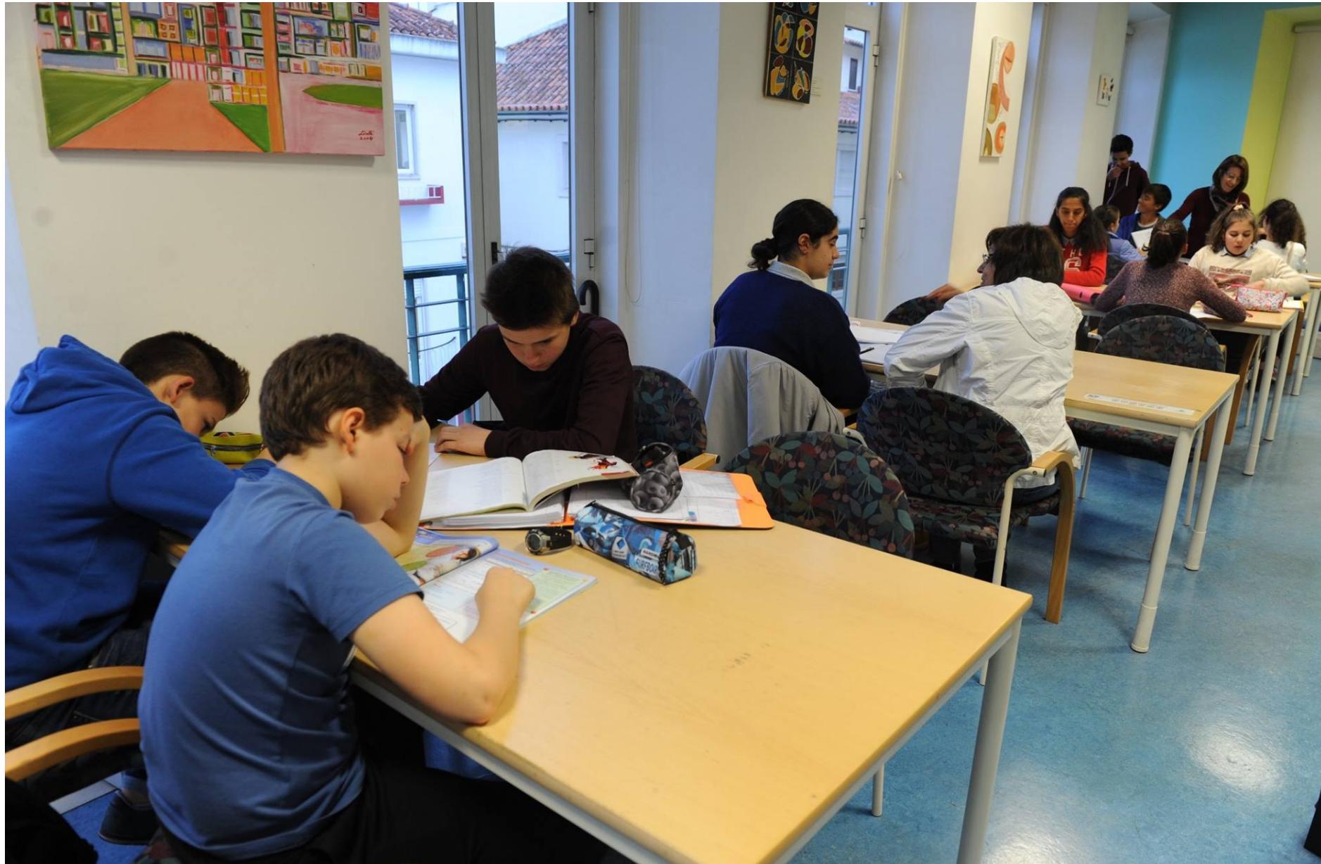
BIBLIOTECA MUNICIPAL AFONSO LOPES VIEIRA