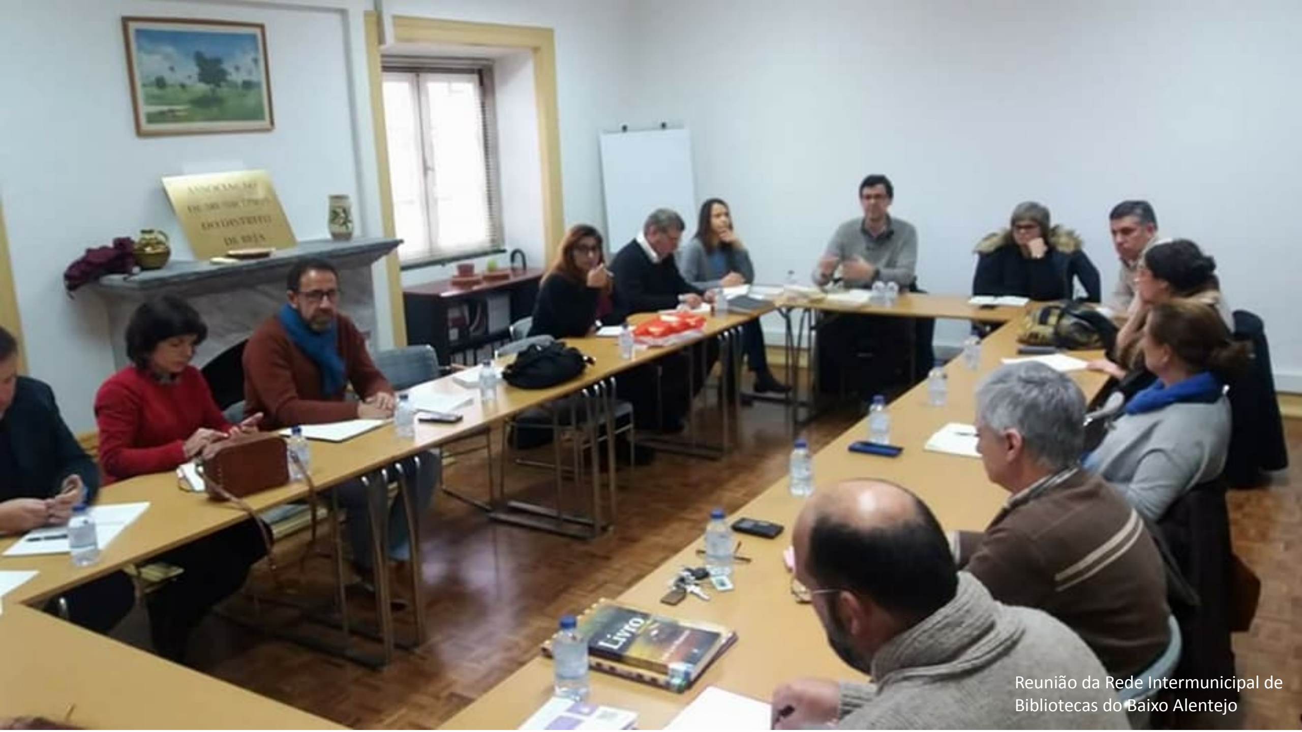
Reunião da Rede Intermunicipal de Bibliotecas do Baixo Alentejo