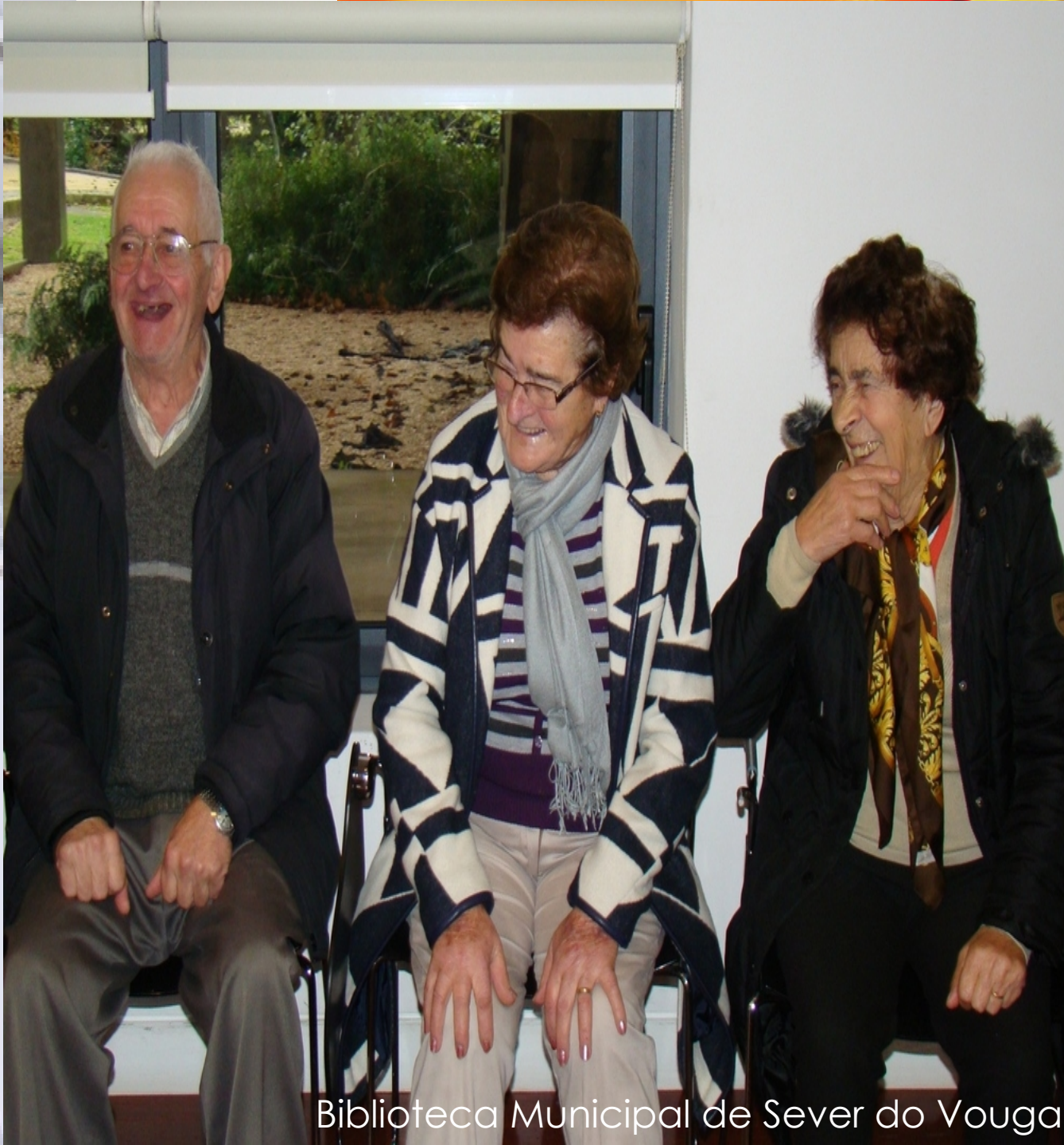
Biblioteca Municipal de Sever do Vouga