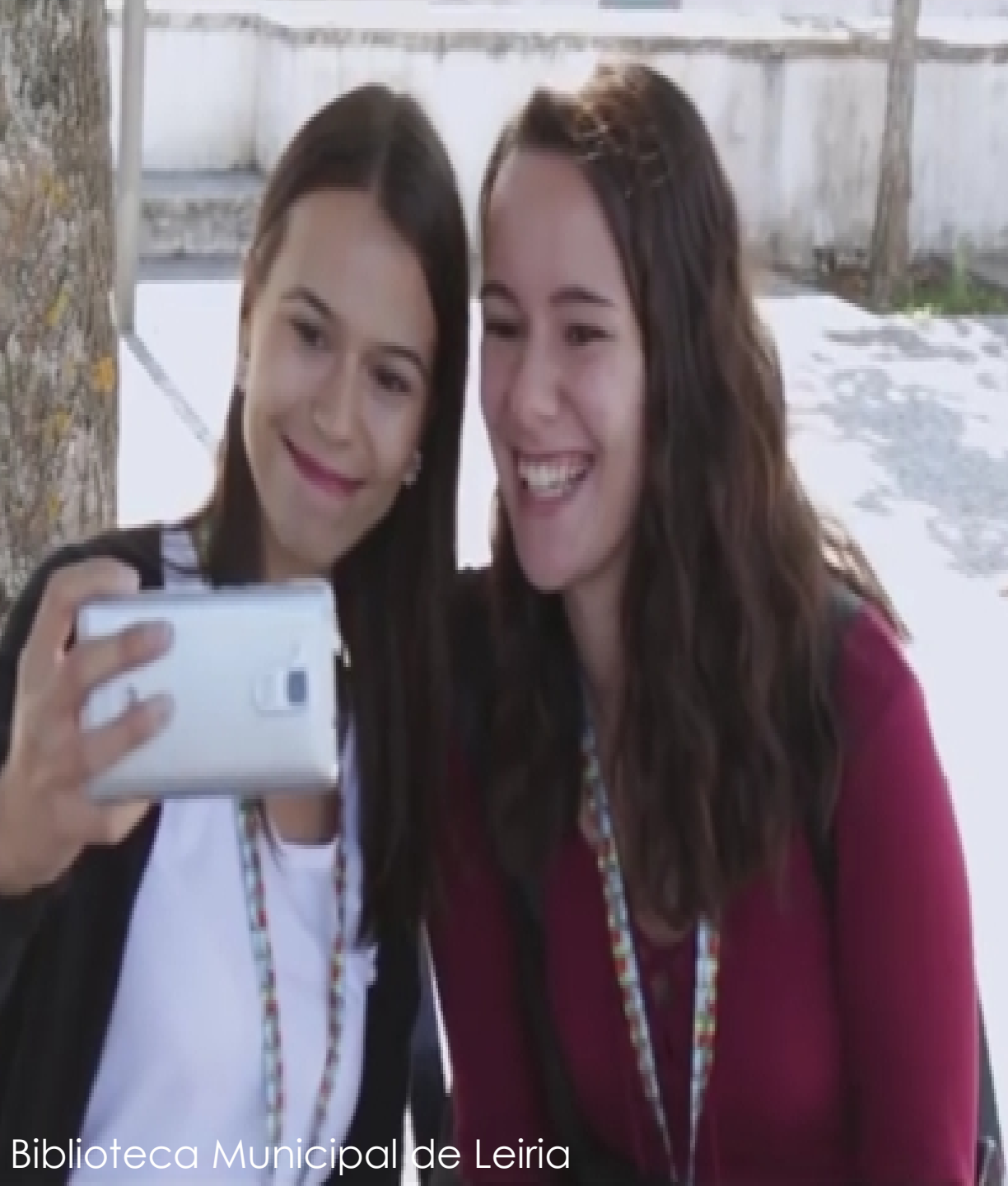
Biblioteca Municipal de Leiria