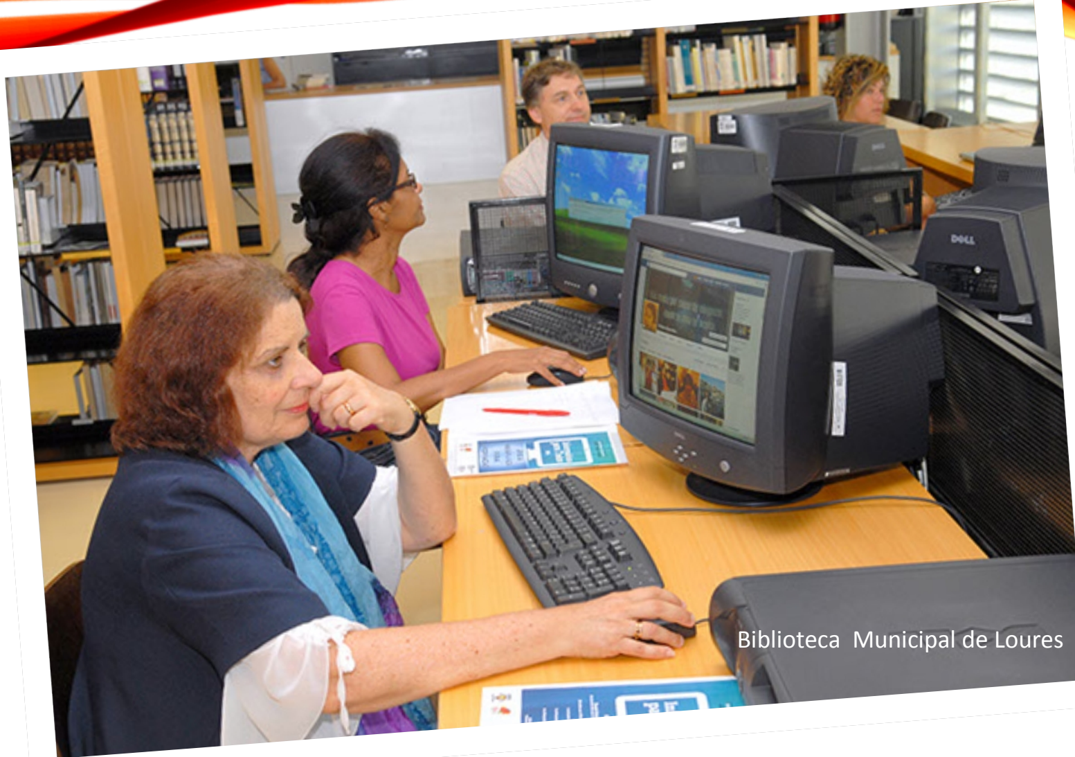
Biblioteca Municipal de Loures

“Facilitar o desenvolvimento da capacidade de utilizar a informação e a informática.” #publiclibrarymanifesto