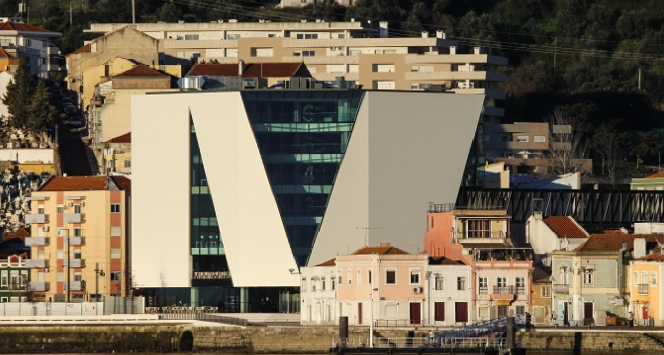
Biblioteca Municipal de Vila Franca de Xira