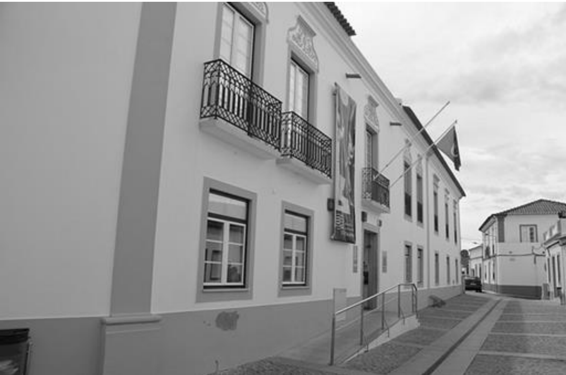
FERREIRA DO ALENTEJO